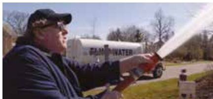
Fahrenheit 11/9 Michael Moore Stati Uniti, 2018, 120'

Per la prima volta, viene raccontata tutta la verità sullo scandalo Watergate, dai primi preoccupanti segnali emersi nel corso della presidenza di Richard Nixon, fino alle dimissioni dello stesso Nixon, e oltre. Nonostante siano stati scritti molti libri e realizzati molti documentari sull'argomento, stranamente la storia del Watergate non è mai stata riportata nella sua vera interezza. In questa miniserie il caso Watergate viene inoltre collocato all'interno del contesto di tutti i problemi che non sono scaturiti, molti dei quali richiamano, con incisiva evidenza, gli avvenimenti di oggi.