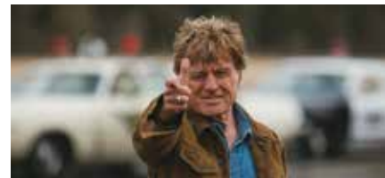
The Old Man & the Gun David Lowery

Il film è preceduto da uno dei corti finalisti del concorso "Cuori al buio".