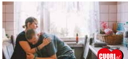
Light as Feathers Rosanne Pel

Uno sguardo provocatorio e sarcastico sull'epoca in cui viviamo. Dopo Fahrenheit 9/11 , il vincitore della Palma d'Oro Michael Moore sposta la sua attenzione su un'altra significativa data, il 9 novembre 2016, giorno in cui Donald Trump è stato eletto 45esimo Presidente degli Stati Uniti. L'ultimo documentario di Michael Moore è un affresco liberale e anticonservatore che non prende di mira solo l'amministrazione degli Stati Uniti, ma anche le politiche dei Democratici e dei Repubblicani che hanno portato all'attuale situazione politica.