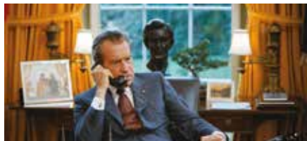
Watergate - Miniserie Charles Ferguson Stati Uniti, 2018, 261' (4 episodi)

P 20/10 Teatro Studio G. B. SIAE 14:30 € 10 Pubb